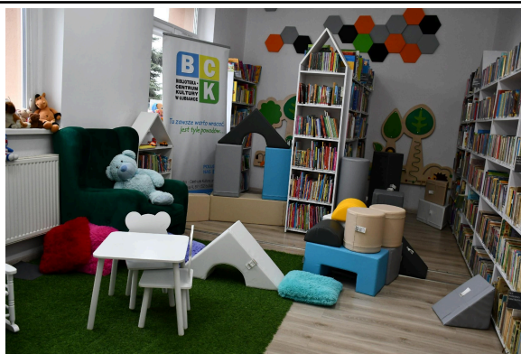
Gmina Łubianka Wyposażenie Biblioteki-Centrum Kultury w Łubiance

Wsparcie lokalnych inicjatyw – Film dokumentalny poświęcony zbrodni dokonanej przez Niemców w lasach Barbarki w 1939 roku realizowany przez Instytut Filmowy Unisławskiego Towarzystwa Historycznego ( przekazanie 5 000.00 zł związanych z nagraniem scen na terenie Brąchnówka oraz gmin LGD)