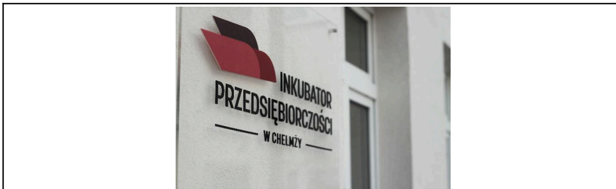
Miasto Chelmża Inkubator przedsiębiorczości w Chelmży