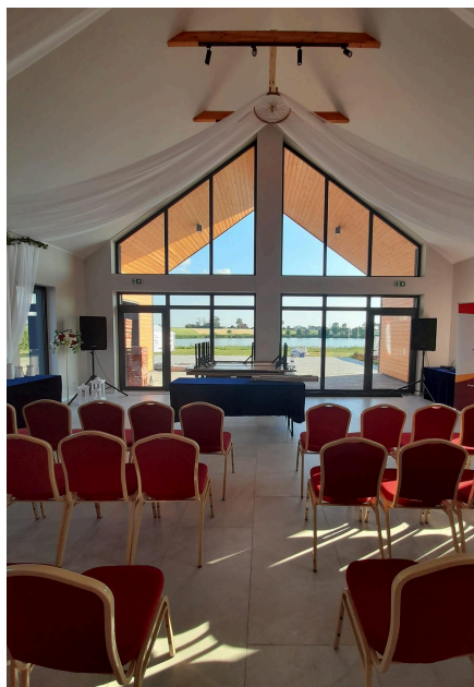
Gmina Chelmża Budowa świetlicy wiejskiej w miejscowości Strużal